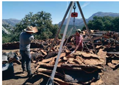
Saca de corcho en los Montes de Propios.

damente. Igualmente ha señalado que se estima una bajada generalizada de la producción por la falta de lluvia, aunque la zona donde se va a desbrozar este año ha sido la menos afectada por la sequía, afirmando que la calidad del producto será bastante buena.