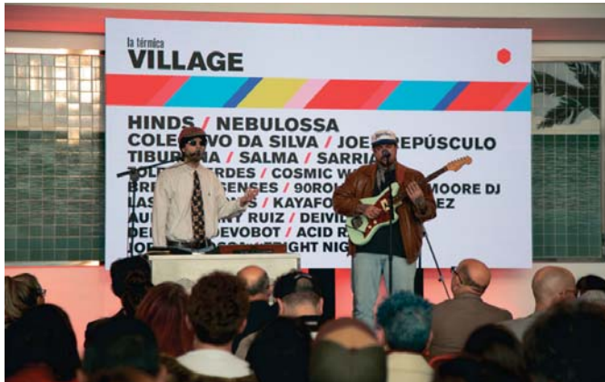
La nueva temporada se presentó en la fábrica Cervezas Victoria con actuación incluida. DIPUTACIÓN

Ronda contará con los directos de los esteponeros Cosmic Wacho, la banda madrileña Tiburona y los granadinos Colectivo da Silva. La formación granadina Colectivo da Silva, fundada en 2017, inicia en Ronda la gira de su tercer disco, 'El Sol', un trabajo producido por ellos mismos con el propósito de seguir exportando el sonido propio y original que popularizaron con el álbum 'Casa Vargas' en 2021. Al mismo escenario se subirán