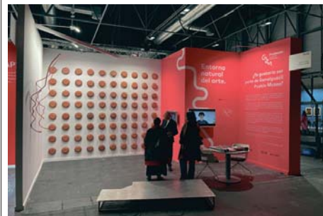
Presencia de Genalguacil en ARCO.