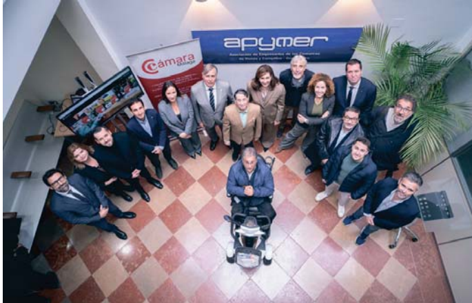
Acto inaugural de la oficina de la Cámara de Comercio en la sede de Apymer en Ronda. CCM

Se refirió también a la fuerza e importancia del sector servicios en la comarca, especialmente desarrollado por