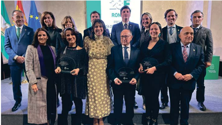
Foto de familia con los galardonados el Día de Andalucía en el acto institucional celebrado en el Convento de Santo Domingo. RS

Además, la cita se cerró con un discurso institucional de la regidora en la que ensalzó la importancia histórica de Ronda en la consecución de la autonomía regional. No en