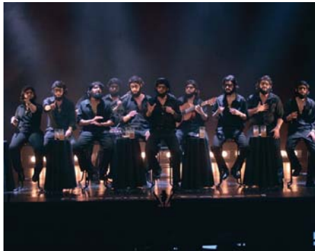
Actuación de 'Los Calaíta' en el Teatro Falla de Cádiz. ÁLVARO GENEIRO

sión de lluvia, los callos populares organizados junto a la asociación cultural carnavalesca, tendrán lugar en los soportales del teatro 'Vicente Espinel', a partir de las 12.00 horas. La gran novedad es que se ha conseguido que actúen en Ronda, a las 13.00 horas, el primer premio de chirigotas del carnaval gaditano, 'Comparsa Los Calaíta (fuimos a por tabaco)'. Una chirigota de toda la vida...', que han sido la gran sensación de la fiesta este año en el concurso del Teatro Falla. Las entradas gratuitas se podrán conseguir en www.giglon.com .