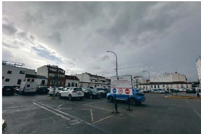
El aparcamiento que existe en la actualidad en los terrenos del antiguo Cuartel de la Concepción. RS

Así las cosas, la previsión es que, tras el periodo de exposición en el Boletín que establece la ley, de cara al mes de mayo pueda licitarse la construcción de esta infraestructura, que según la previsión del estudio de viabilidad