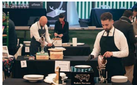
El domingo se celebró el concurso de cortadores de jamón. RS

El domingo por la mañana tuvo lugar la XI edición del Concurso de mejor presentación y puesta en escena de Cortadores Profesionales de Jamón.