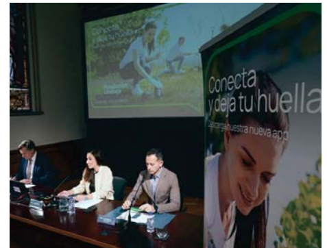
Presentación de la nueva aplicación del Club de Voluntarios.

de la comunidad en proyectos que generen un impacto positivo en la sociedad y fomenten una cultura de la solidaridad y la colaboración. Desde su lanzamiento, más de un millar de personas se han involucrado en sus acciones y actividades. La institución da un paso más en su apuesta por la digitalización y el uso de nuevas tecnologías, al impulsar herramientas y nuevas utilidades que acerquen su labor a la sociedad y que contribuyan a conectar a las personas, promover el voluntariado y construir un futuro más inclusivo y sostenible.