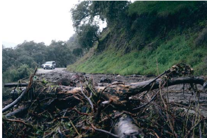
Las lluvias del pasado lunes afectaron a varias zonas en la comarca de la Serranía de Ronda. RS

Sobre las 15.15 horas se envió vía teléfono móvil a la ciudadanía la Alerta de Protec-