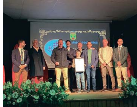
Varios miembros del club recogieron el galardón.