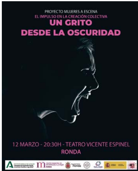
Cartel de la obra que se presenta el miércoles 12 de marzo. RS

Se trata de una iniciativa que tuvo un magnífico resultado el pasado año y donde las propias participantes escriben el guion de lo que luego escenifican en la obra y que está basado en sus propias experiencias personales, por lo que la concejal no dudó en calificar esta iniciativa como realmente 'terapéutica' para las mujeres que la conforman en lo que definió como un acto de "mucho valentía". La concejal de Igualdad señaló que, en estos meses, ha habido un gran trabajo en la gestión de las emociones que permite ahora liberar