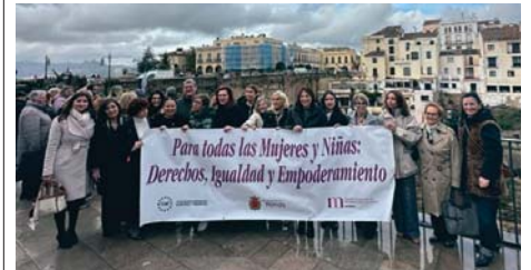
Encuentro de la Comisión de Igualdad de la FEMP en Ronda.