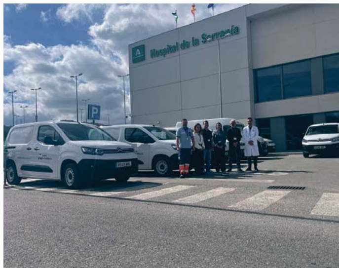
Presentación de la nueva flota de vehículos en el Hospital de la Serranía.

Los nuevos vehículos, que cuentan con la etiqueta de emisiones C, están equipados con sistemas de localización GPS que permiten un control en tiempo real, la gestión personalizada de datos y el acceso a la información a través de internet sin necesidad de instalaciones adicionales. Estas unidades forman parte de los 55 vehículos asignados a la