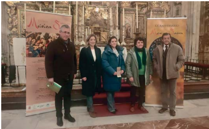
Presentación de la vigésima edición del Ciclo de Música Sacra de Ronda.