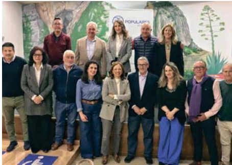
El alcalde de Montejaque formaliza su entrada en el PP de Málaga.