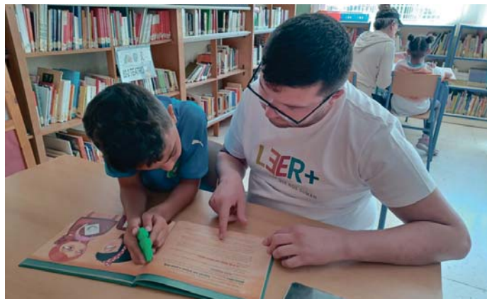
Abierta la campaña para captar voluntariado. FUNDACIÓN JOSÉ MANUEL LARA

LEER+ es un programa de acompañamiento lector que se desarrolla en sesiones semanales de una hora, contribuyendo al progreso académico del alumnado y reduciendo el abandono escolar. Para poder implementar este proyecto la entidad contará con la colaboración del Club de Voluntarios de la Fundación Unicaja para el proceso