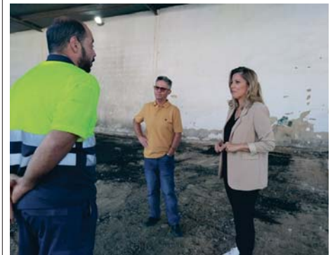
La delegada ha visitado las instalaciones de Soliarsa.