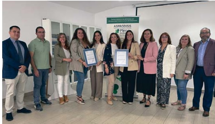
Entrega de los distintivos en la sede de Asprodisis en Ronda.

Con este reconocimiento, el equipo de la entidad vuelve a poner de manifiesto su compromiso con la mejora continua y la calidad de la asistencia que prestan a las personas usuarias, garantizando que su actividad se ajusta a los es-