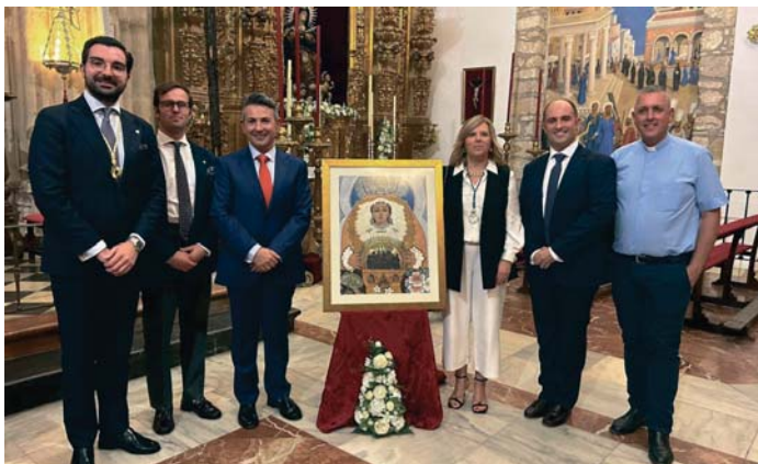
Presentación del cartel de la Hermandad de la Aurora. HDAD. AURORA

Los días 25 a 27 de septiembre tiene lugar el Devoto Triduo en honor a Ntra. Sra. de la Aurora, celebrándose cada día a las 20:00 h. en la Cole-