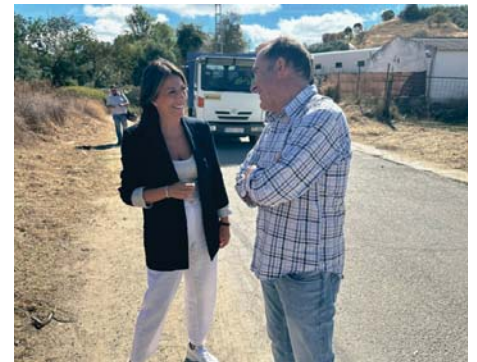
Visita a las obras del camino de Navares y Tejares. RS

Ésta no es la única actuación que tiene pendiente Pedanías, ya que en las próximas semanas se van a invertir alrededor de 145.000 euros en varias actuaciones.