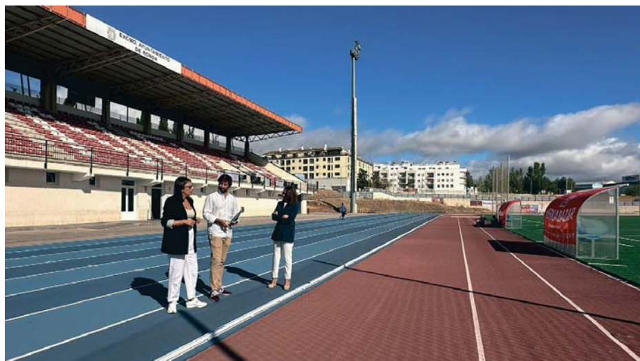
Visita a la Ciudad Deportiva de Ronda, donde se acometerá esta segunda fase de los trabajos. RS

Como ha indicado la regidora local, "desde el área de Obras tenemos ya el proyecto de renovación de estas pistas de atletismo, que serían la segunda fase de la actuación, ya que la primera la acometimos hace unos meses. Así, dedicaremos la subvención a completar la remodelación de las cinco calles que componen estas instalaciones deportivas muy demandadas por los usuarios, además del entorno del resto de disciplinas dedicadas al atletismo, es decir, el área de salto de longitud, de altura y lanzamiento de peso".