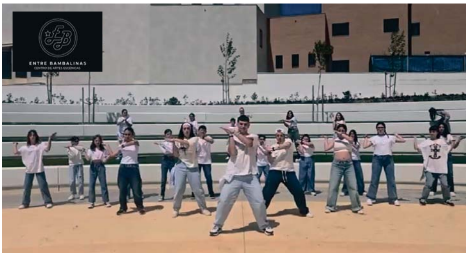
El Centro de Artes Escénicas lleva ya seis años ofreciendo un amplio abanico de posibilidades en el ámbito cultural. ENTRE BAMBALINAS

NUEVO CURSO _Aún quedan plazas en alguna de las disciplinas que imparte