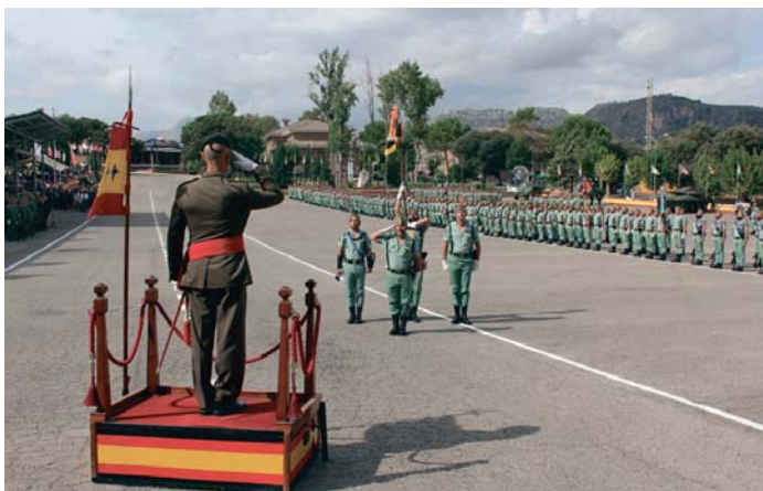
Acto del Día de La Legión en el acuartelamiento de Montejaque.

ACTO Estuvo presidido por el General de la División "Castillejos"