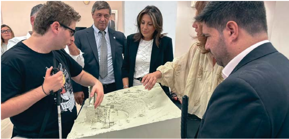
Visita al Museo de Ronda, donde se encuentra la maqueta interactiva del teatro romano de Acinipo. RS

INICIATIVA La maqueta ha sido elaborada por arqueólogos de la Universidad de Málaga a través de un estudio con dron de los restos de la ciudad romana