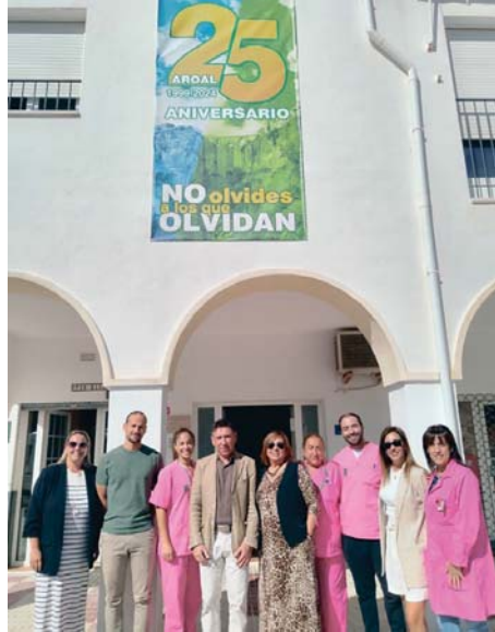
AROAL celebra su veinticinco aniversario. RS

Para ellos, son tiempos de agradecimiento, ya que hace 25 años “comenzamos con un esfuerzo muy grande, con mucha ilusión y con un objetivo claro de lo que queríamos, y gracias a todas aquellas personas que confiaron en nuestro trabajo y con su ayuda fuimos capaces de llegar donde estamos hoy, es tiempo de agradecimiento a todos y cada uno de los que