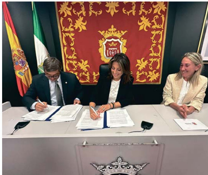
Firma del convenio entre el Ayuntamiento de Ronda y la Universidad de Málaga. RS

Para que sea una realidad, entre otras cuestiones, se ha contemplado la creación de una Comisión Mixta entre el Ayuntamiento y la Universidad de Málaga, que debe ponerse en marcha en un máxi-