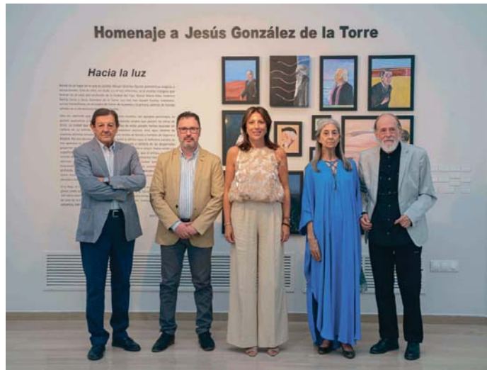
Inauguración de la exposición dedicada al desaparecido artista, Hijo Adoptivo de Ronda. FUNDACIÓN UNICAJA

La propuesta también exhibe los retratos de ilustres autores de las letras españolas