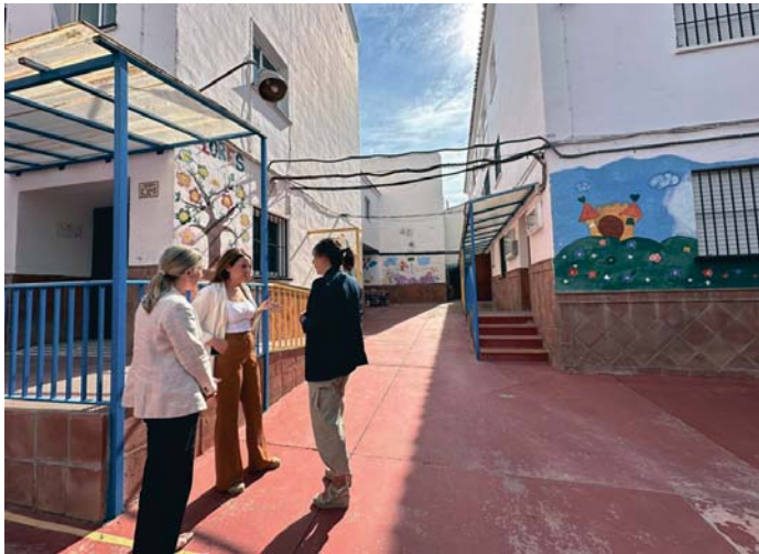
Visita al colegio de Padre Jesús, que se transformará en unas dependencias para usos culturales. RS

De esta manera, se ha previsto que en el edificio principal se van a reorganizar las dependencias, de manera que haya menos aulas, pero más amplias, para dar cabida a los talleres socioculturales y a otras actividades que se puedan organizar desde el Ayuntamiento. También se instalará un ascensor para hacer el edificio accesible, se adaptarán los baños y se colocarán máquinas de aire acondicionado en la planta baja, que es donde se ha previsto que se celebren las cla-