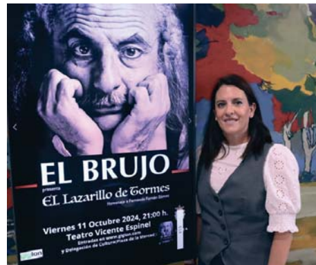
Presentación de las obras de teatro del mes de octubre. RS

La edil ha invitado a los amantes del teatro a que reserven huecos en sus agendas para acudir a sendas citas que proponen diversión y buen hacer a partes iguales.