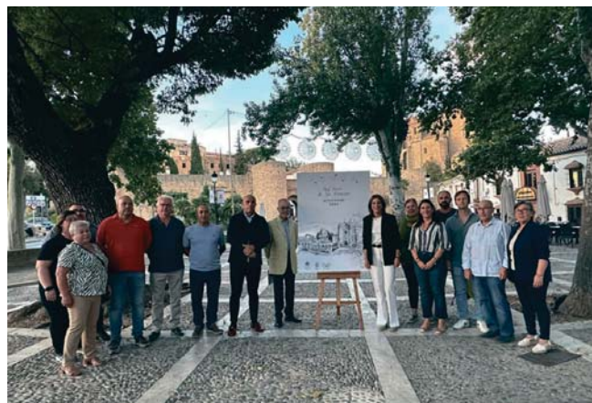
Presentación del cartel anunciador de la Real Feria del Barrio de San Francisco. RS

La imagen que ilustra el cartel anunciador de esta tradicional feria es una obra que