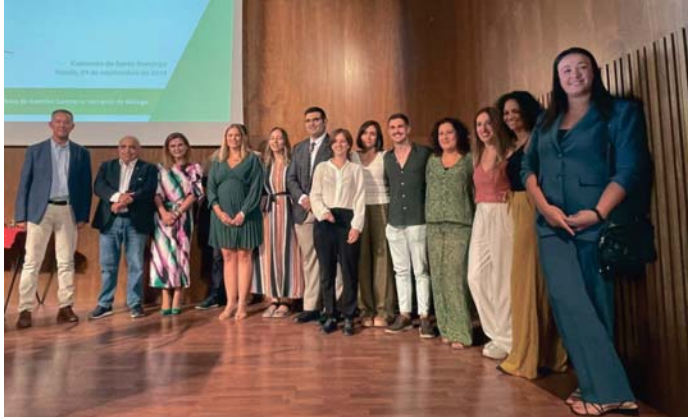
Acto de despedida a los residentes del Área de Gestión Sanitaria Serranía. M.O.

La directora del AGS destacó la celebración del acto en el Convento de Santo Domingo con el objetivo de "darle visibilidad a la ciudad de Ronda, para que se vea que es un sitio estupendo para que los residentes hagan su residencia. Ya se sabe que es una zona de difícil cobertura en el ámbito sanitario, pero la verdad es que un área que inte-