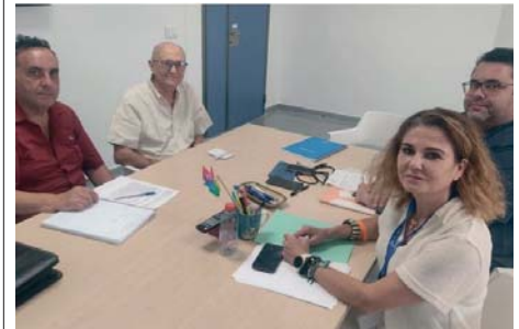
Reunión con la Gerencia del Hospital. FED. VECINAL

Además, reducir las listas de espera, dotando al hospital de Ronda de un programa de autoconcierto, y ampliar a tres los equipos de ambulancias medicalizadas.