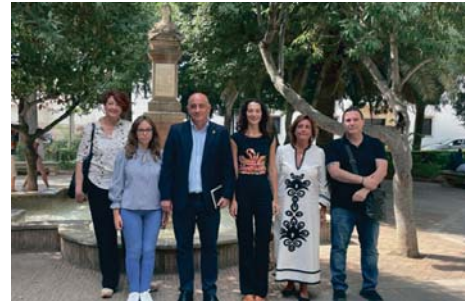
Los concejales del Grupo Municipal Socialista.

A su juicio, se trata de un proyecto de una envergadura muy importante “para que el equipo de Gobierno hubiese informado previamente a los vecinos y hubiese puesto todas sus herramientas y su equipo jurídico para poder buscar una alternativa a este proyecto que va a provocar un gran impacto si finalmente llega a realizarse en la peda-