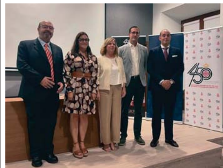
Ponencia en el Centro Cultural Fundación Unicaja. HDAD. STO. ENTIERRO