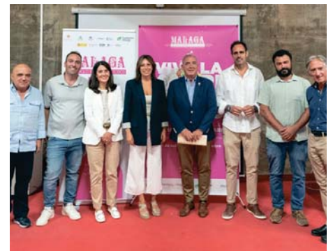
Presentación en Ronda de la Ruta Maridaje Centenario. RS

El objetivo es poner en valor la rica tradición vinícola de la provincia.