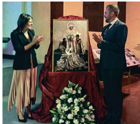
Presentación del cartel en Santo Domingo. HDAD. COLUMNA

Ese mismo sábado, se inaugurará la calle Nuestro Padre Jesús en la Columna y el retablo cerámico en su honor,