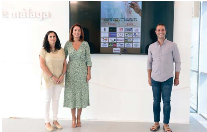
Momento de la presentación del certamen en la sede de la Diputación de Málaga.