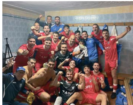
El Ronda celebrando la victoria a domicilio del pasado fin de semana.