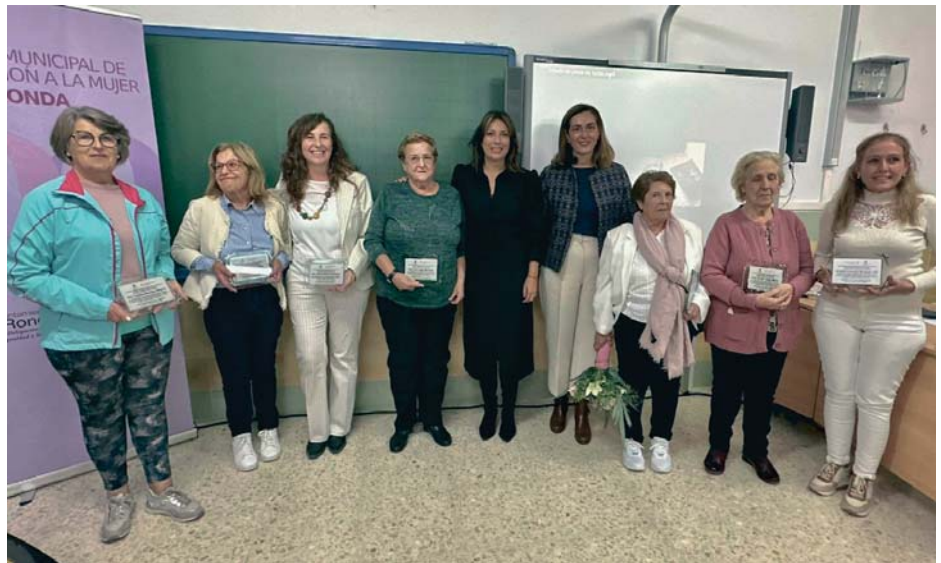
Celebración del Día Internacional de las Mujeres Rurales en Los Prados. RS

A continuación se rindió homenaje a mujeres rurales que han tenido un impacto significativo en sus respectivas comunidades, siendo los alcaldes y alcaldesas pedáneas y representantes de cada zona los encargados de presentar historias de vida inspiradoras de estas mujeres, destacando su labor en el desarrollo rural y comunitario.