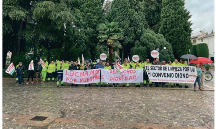
Concentración de trabajadores de la empresa municipal de limpieza el pasado lunes.

Los trabajadores reclamaron que Soliarsa sea renovada, que se aumente la plantilla y que se faciliten las herramientas adecuadas para la prestación del servicio, así como un plan de trabajo a largo plazo, y pidieron que “los que están gestionando Soliarsa tengan formación relacionada con la recogida de residuos, la sostenibilidad y la limpieza de áreas urbanas”, instando a la Administración local a escuchar a los empleados de la empresa municipal por su conocimiento del sector desde la experiencia y a que “nuestra opinión cuenta”. “Ya estamos cansados de que no nos den la importancia que nos merecemos, que no nos escuchen y que tomen decisiones sin contar con nosotros, ya es hora de que se den cuenta de que nosotros somos un servicio básico y necesario para Ronda, y que la limpieza, salubridad y estética de nuestra ciudad dependen de nosotros”.