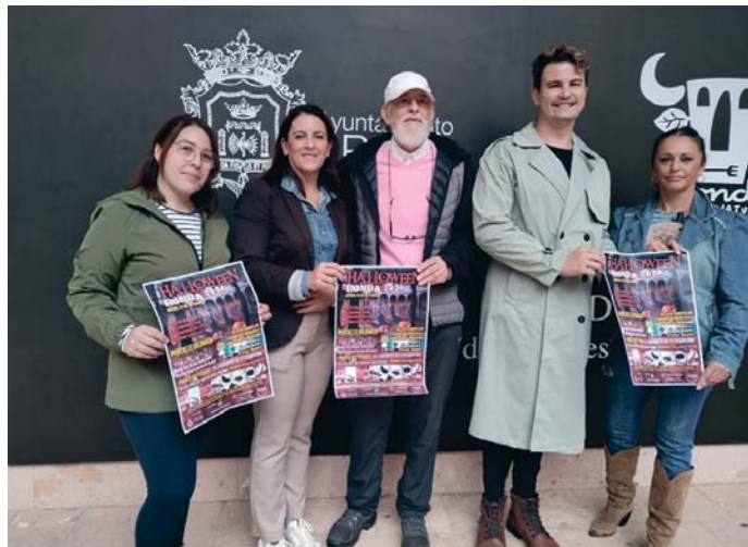
Presentación de la programación prevista para celebrar Halloween. RS

Por otro lado, y un año más, Entre Bambalinas y Tierra de Historia serán los encargados de poner los pelos de punta a