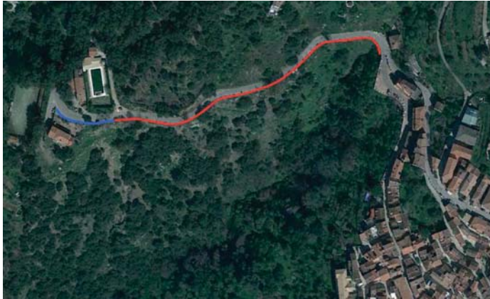
Presentación de la XXIII Semana de la Música en al Real Maestranza de Caballería.

El paseo de Las Cruces se convertirá en un anexo de la etapa 27 de la Gran Senda de Málaga, y el Ayuntamiento de