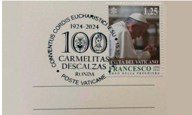
El Vaticano dedica un matasellos al Centenario del Carmelo de Ronda. VATICAN NEWS

El matasellos conmemorativo está compuesto por el logotipo del Centenario, compuesto por el número cien, dentro del cual aparecen el escudo de la Orden Carmelitana y el relicario de la mano de santa Teresa de Jesús.