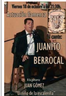
Cartel de la actuación.