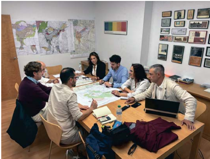
Reunión técnica sobre el nuevo Plan General de Ronda. RS

Una vez finalizado, el avance se va a presentar a través de la Comisión de Seguimiento del Plan General, al tiempo que se remitirá a las respectivas delegaciones territoriales de la Junta de Andalucía para que lo estudien y analicen de manera pormenorizada. "Es una tramitación larga, pero debemos tener en cuenta que se trata del mayor proceso transformador de Ronda que se va a vivir en los últimos