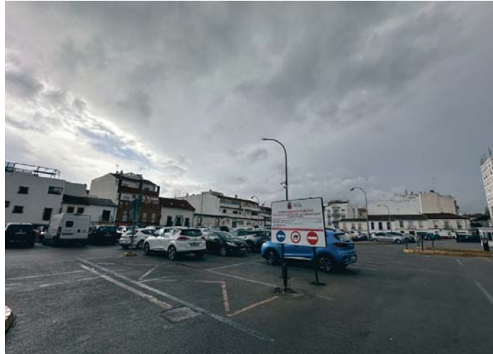
Estacionamiento actual en los antiguos terrenos del Cuartel de la Concepción. RS

Para ello, el documento cuyo gasto se ha aprobado ahora debe recoger desde las dimensiones de la futura plaza, hasta los materiales que se van a emplear en la futura obra y el diseño previo del mismo.