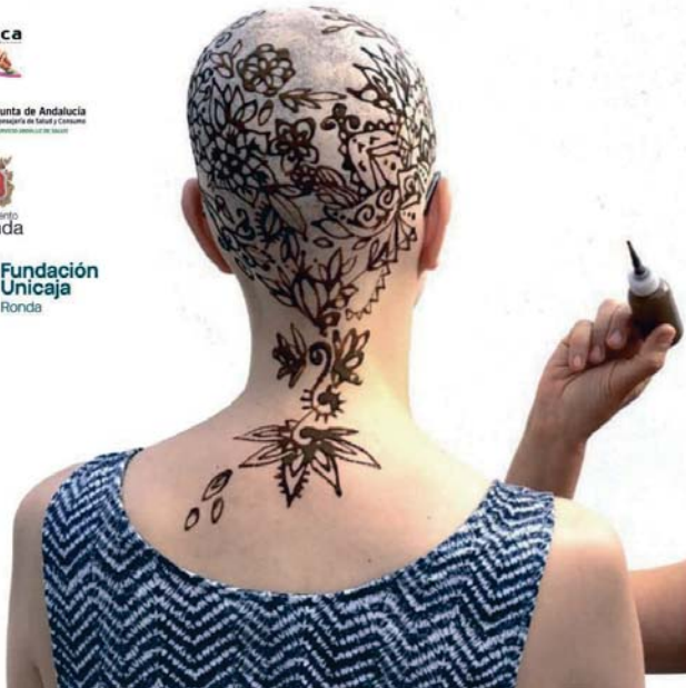
Cartel anunciador de las jornadas que Ayuca celebrará este sábado en Ronda.