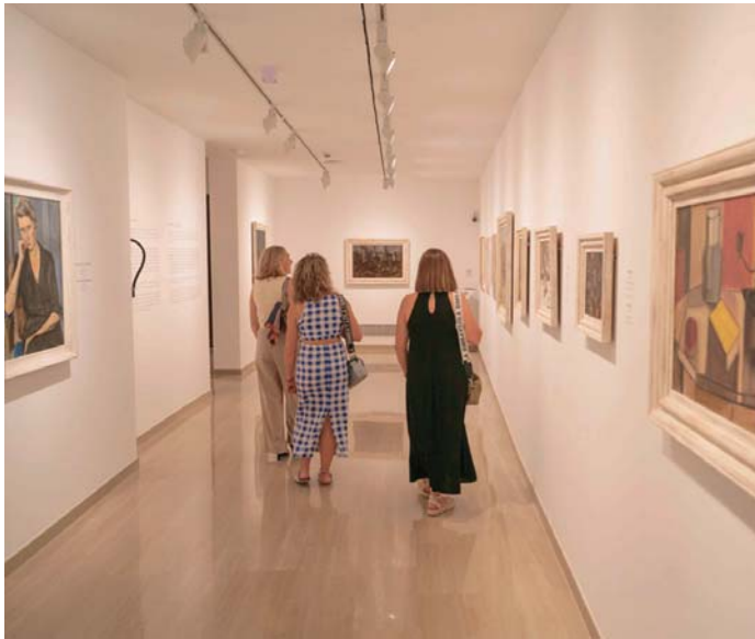
La iniciativa se enmarca en el programa educativo de la Fundación Unicaja Ronda. FUNDACIÓN UNICAJA

La obra magistral del artista rondeño Joaquín Peinado inspira esta iniciativa enmarcada en el programa educativo de la Fundación Unicaja Ronda que persigue profundizar en la difusión de la figura y obra del ilustre pintor y su relación con las distintas modalidades artísticas y los