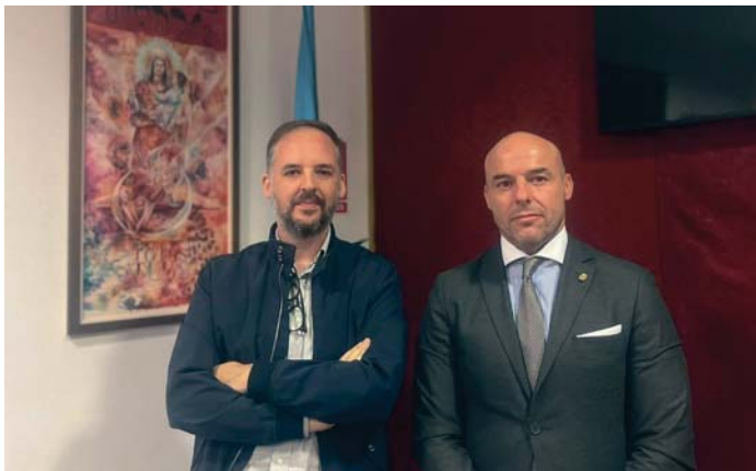
En la imagen superior el pregonero de la Semana Santa y en la inferior el autor del cartel. RS

Santa Catalina en Faraján y Alpendeire. Actualmente es vicario parroquial de San Juan Bautista de Vélez-Málaga y párroco de Santa Catalina Mártir de Arenas, Inmaculada Concepción de Daimalos y San Isidro Labrador de Trapiche. Además, es hermano de hermandades como Monte Calvario, la Hermandad de los Remedios de Málaga, la Hermandad de la Pastora de Santa María de Sevilla y hermano de la Virgen de la Paz de Ronda. Ha sido pregonero de la Hermandad de la Columna de Ronda y presentador del cartel oficial de la Semana Santa rondeña de 2022.