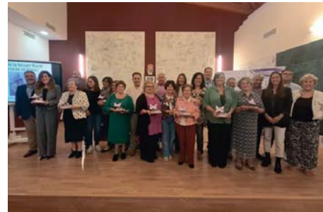
Las mujeres homenajeadas. RS

Todas ellas motor en sus municipios como emprendedoras, enfermeras, pioneras