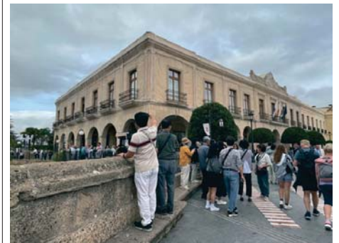
Un grupo de turistas en el Puente Nuevo de Ronda. MQ

En cuanto a la procedencia, durante el mes de julio se observa un incremento significativo en la llegada de turistas internacionales (+17,64%), lo que sugiere un aumento de la visibilidad y atractivo de Ronda en el mercado internacional. También hubo un notable aumento en el turismo nacional (+14,75%). En agosto, el turismo internacional continuó creciendo (+6,89%), si bien el nacional experimentó una leve disminución (-2,12%), habitual durante una época en la que el sector busca como atractivo estar cerca de la playa. En resumen, los niveles de visitantes a nivel global han experimentado un crecimiento positivo, de acuerdo con la tendencia del primer semestre.