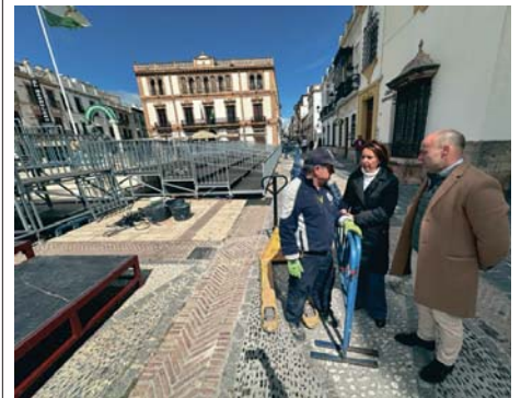
La delegada y el presidente de la Agrupación, durante la visita. RS

El presidente de la Agrupación de Hermandades ha dado a conocer que a partir del próximo lunes día 7, en horario de 12.00 a 14.00 y de 18.00 a 20.00 horas, se podrán adquirir los abonos para las sillas de la carrera oficial. Serán cerca de un centenar, algunos para la zona de la Plaza del Socorro pero, principalmente, para las sillas de calle Molino.