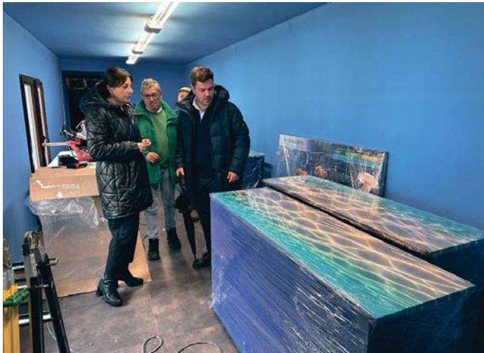
Visita al museo, donde han comenzado los trabajos. RS

La licitación de la actuación se dividió en tres lotes: en el de suministros, que fue adjudicado a Imprenta Galindo por 72.702,85 euros y que incluye los paneles, vitrinas y contenidos necesarios; en el de obras, que ejecuta la em-