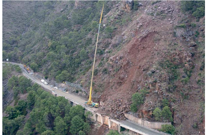
La Junta avanza en los trabajos para la reparación de la A-397.

“Seguiré liderando el movimiento para la mejora de las carreteras. Nuestro objetivo es la mejora de todas las comunicaciones, de la A-397 y también la autovía”, concluyó la alcaldesa.