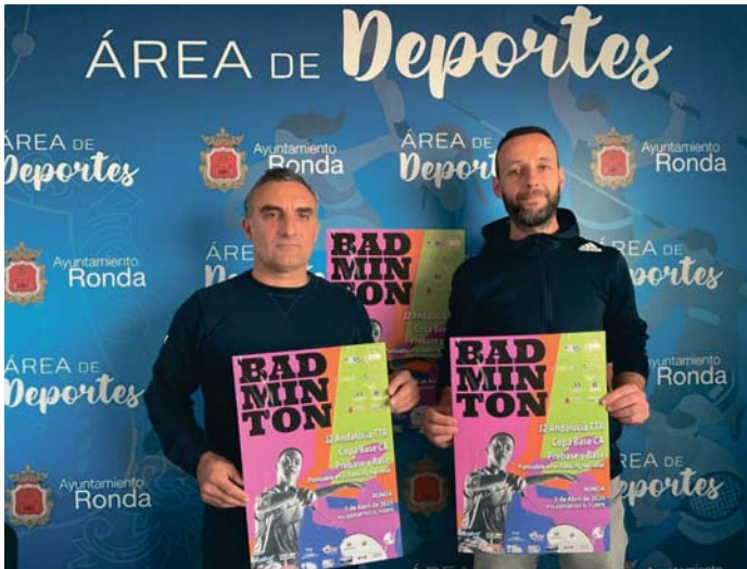
Presentación del campeonato de Bádminton. M.Q.

Serán un total de 260 partidos los que se desarrollarán, que comenzarán a las 9.00 ho-