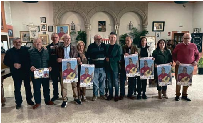
Presentación de la XXIX edición del Concurso 'Aniya la Gitana'. M.Q.

La delegada de Cultura felicitó a la Peña por estos 29 años de concurso, detrás del que, aseguró, "hay muchísimo trabajo, porque trabajan los 365 días del año. Es una asociación muy activa, con ganas de hacer muchas cosas, una gran familia".