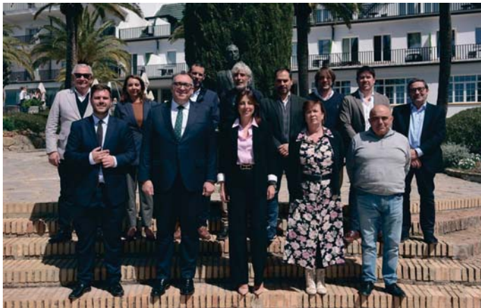
El consejero de Turismo se reunió en Ronda con representantes del sector para explicar las propuestas.

Hay que recordar que la alcaldesa también se reunió esta semana con Apymer y que este ente le pidió coordinar el citado encuentro con estas