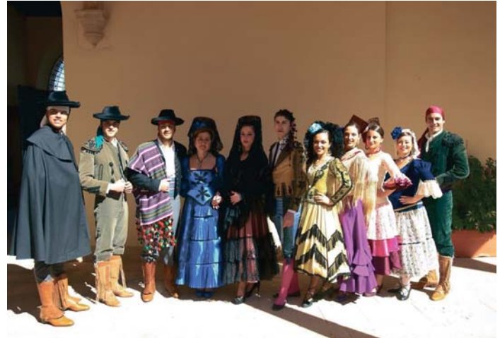
Uno de los concursos se centra en la vestimenta de Ronda Romántica. RS

La intención es incentivar a todo el mundo para que se vista tanto en la Gala Romántica, el 25 de abril, y en el pasacalle que abrirá la fiesta, el