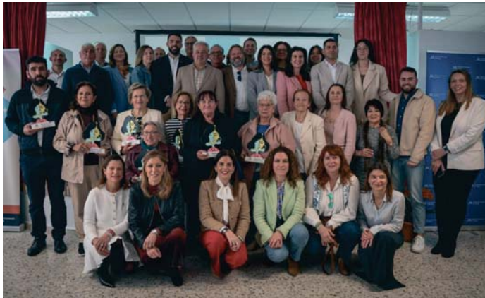
Homenaje celebrado en Jubrique.

La gala de este martes homenajeó a 12 mujeres de las comarcas de la Serranía de Ronda y de la Costa del Sol occidental.