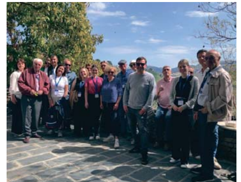
El grupo de agentes de viajes alemanes, en Ronda. RS

Esta acción se enmarca en la estrategia de Turismo Andaluz para consolidar la posición de Andalucía como destino preferente en el mercado alemán.