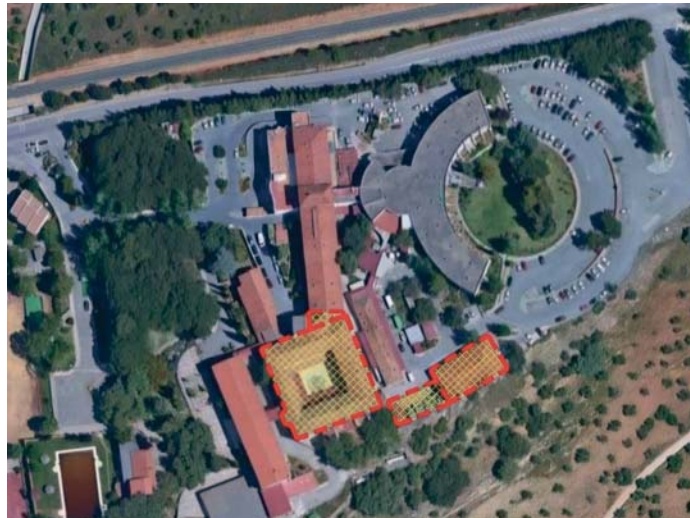
El proyecto abarca tres edificios del complejo actualmente en desuso. RS

La alcaldesa insistió en que el fomento de la oferta de estudios universitarios en Ronda es prioritario para el Ayuntamiento, puesto que "se trata de un motor educativo y cul-