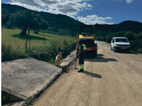
Arreglo de carreteras. DIPUTACIÓN

En la carretera MA-8307, en el término municipal de Jimera de Líbar, los trabajos se adjudicaron por 328.885,12 euros a Áridos Anfersa SL. En este caso, se ha actuado a lo largo de unos dos kilómetros (desde la carretera MA-8401 hasta la mencionada localidad) con el refuerzo de firme mediante el extendido de una capa de aglomerado a lo largo