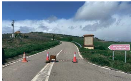
Los equipos de conservación señalaron la zona.

El yacimiento de Acinipo, en la órbita romana en el siglo III a.C. y que experimentó un gran desarrollo como ciudad entre los siglos I d.C. y IV, se ubica en una gran área caliza de origen terciario, con una altitud media de 999 metros sobre el nivel del mar, a 18 kilómetros de Ronda.