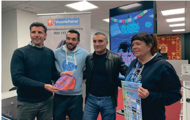
Presentación de la quinta edición de 'Brazadas Solidarias'. MQ

Las pruebas comenzarán a las 10.00 de la mañana y se puede contribuir participando en las pruebas de natación, con la 'fila o' o acudiendo a la paella en el