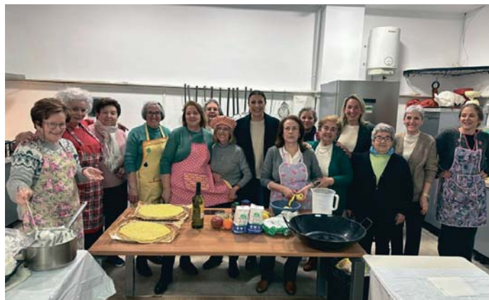
Visita al taller sociocultural de cocina. RS

Estas nuevas plazas se han ofertado en los talleres más solicitados, en un total de siete, con 11 grupos y se distribuyen de la siguiente forma: 30 en tres grupos de 'Corte y Confección'; 25 en un grupo de 'Zumba'; 24 en un grupo de 'Bailes de Salón Nivel 0', 20 en un grupo de 'Aquazumba',