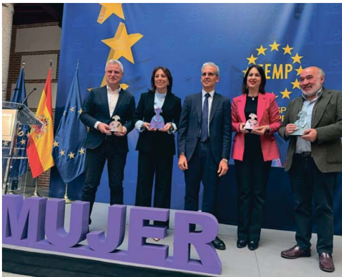
La alcaldesa, durante el acto de entrega del premio en Madrid. RS

La alcaldesa destacó el trabajo del Centro Municipal de Información a la Mujer (CIMM), que ha liderado este proyecto, que ha impulsado una red de establecimientos cuyo personal ha sido formado para prevenir, prestar apoyo e intervenir en caso de