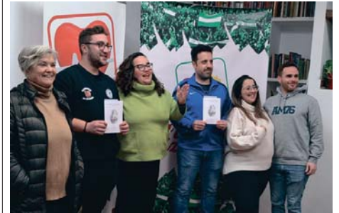
Entrega de los premios en la sede de IU.

En el caso de la chirigota de la UVA, la letra refleja, en relación con la sanidad, el punto de vista de los funcionarios, ya que "cuando vamos a la administración somos muy pesados, y vamos a quejarnos a ellos sin que tengan culpa ninguna, hay que reivindicar que hace falta personal sanitario, que los funcionarios no tienen culpa y están ahí aguantando, y los que hacen falta son los que salvan vidas", indicaron.