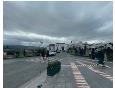
El Ayuntamiento trabaja en un vial alternativo al Puente Nuevo. MQ

El Ayuntamiento de Ronda trabaja actualmente en la construcción de un vial alternativo al Puente Nuevo, que se proyecta por el citado punto del municipio, con el objetivo de mejorar la movilidad en la ciudad de Ronda, especialmente en el conjunto histórico, y aliviar el tráfico que soporta el citado monumento diariamente.