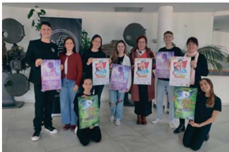
Presentación de los espectáculos de Entre Bambalinas. AS

De esta manera el calendario estará compuesto de las si-