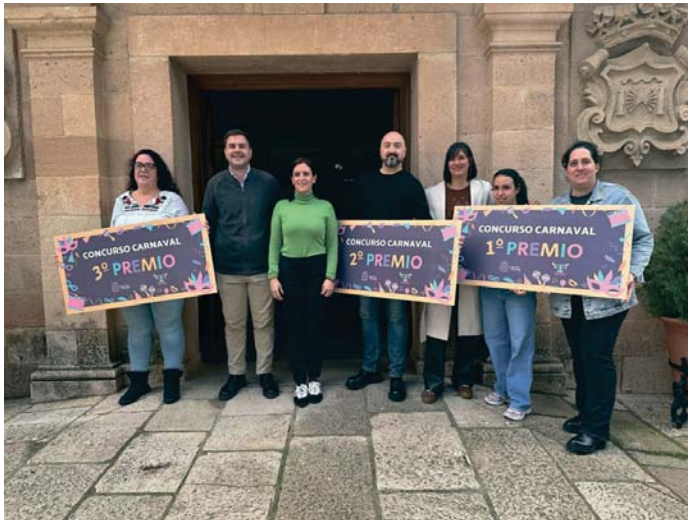
Entrega de los premios a los tres galardonados del II Concurso de Disfraces de Carnaval. RS

De esta manera, el primer premio de la segunda edición