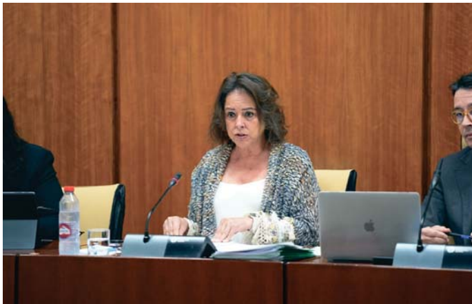
La consejera de Sostenibilidad y Medio Ambiente de la Junta de Andalucía. JOAQUÍN CORCHERO/PARLAMENTO

García ha recordado que de 2016 a 2018 "sólo se presupuestó para el Parque 1,3 millones de euros" y ha subrayado que las actuaciones puestas en marcha por la Junta "son un ejemplo de cómo la protección de nuestro patrimonio natural puede ir de la mano con el desarrollo socioeconómico" y con "el disfrute ordenado por parte de la ciudadanía".