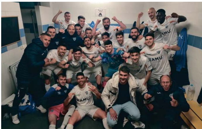
Los jugadores del CD Ronda celebrando la victoria del pasado fin de semana.