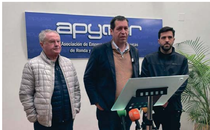
El secretario de Apymmer y los representantes de la Plataforma anunciaron la convocatoria.