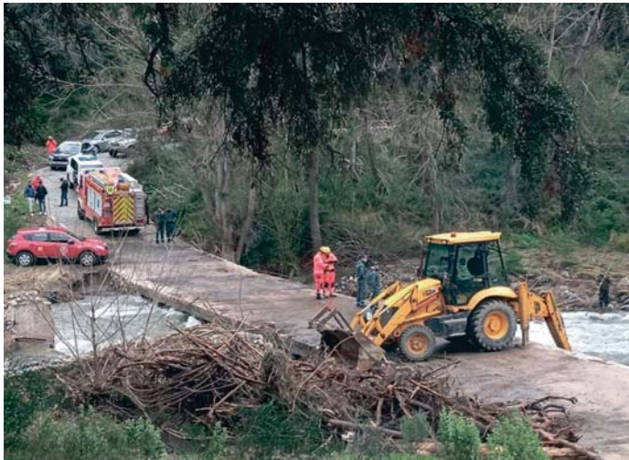
Dispositivo de búsqueda establecido para encontrar el cuerpo del motorista.

Desde que hallaron el vehículo, la búsqueda no ha parado durante varios días hasta encontrar el cuerpo