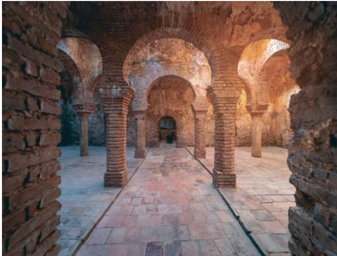
Se intensificará la promoción de Ronda y la comarca de la Serranía. AVITO, RONDA

En línea con esta estrategia, se llevarán a cabo un refuerzo significativo en la promoción turística de Ronda a través de activaciones específicas en los aeropuertos de