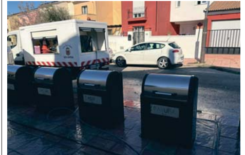
Concluye que la gestión ha sido correcta. AVITO, RONDA

De este modo, esta auditoría, en la que se recogían áreas con posibles incidencias,