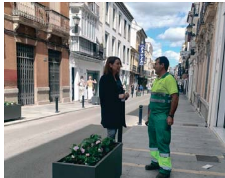
La delegada ha visitado los trabajos en calle Los Remedios.

A su vez, también se están podando árboles en toda la ciudad para que los pasos de palio puedan pasar sin problemas y arreglando los naranjos en lugares como calle Jerez o Plaza de España. La intención es que todas estas actuaciones finalicen a principios del mes de abril.